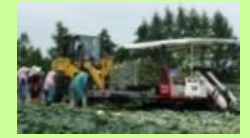
機械化体系の導入